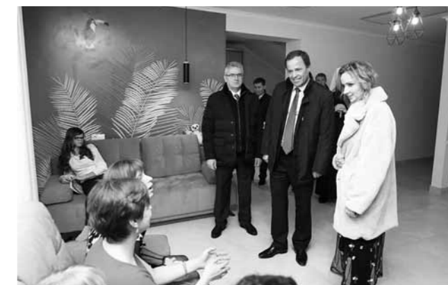
Губернатор Пензенской области Иван Белозерцев, полпред президента РФ в ПФО Игорь Комаров и Мария Львова-Белова на встрече с новоселами