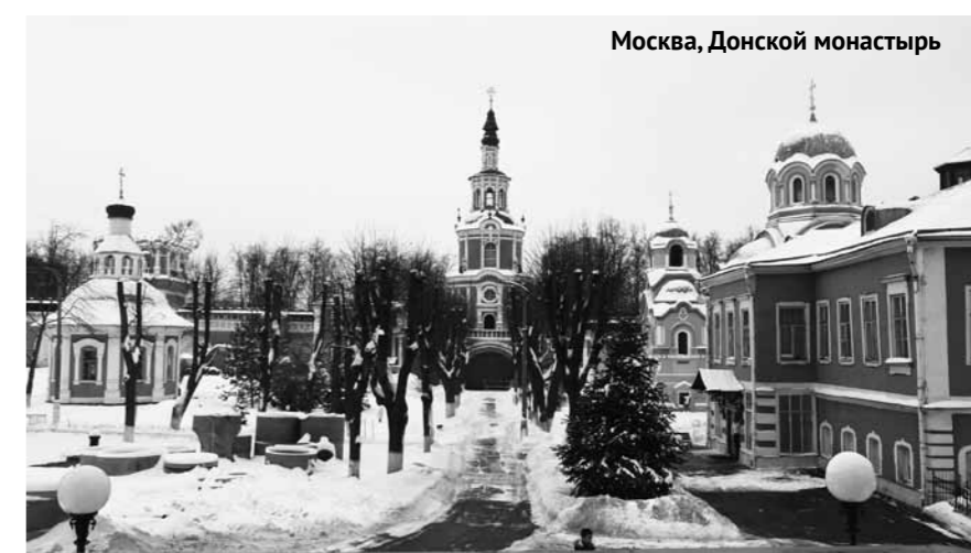
Москва, Донской монастырь

22 декабря. Пензенская область. Сердобский район. Сазанье: Казанская Алексиево-Сергиевская