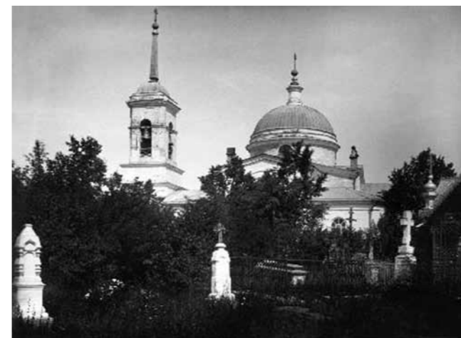
Воскресенская кладбищенская церковь г. Саратова. Фото нач. XX в.